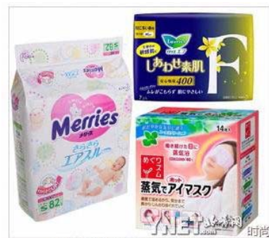
最受华人欢迎的20款日本人气商品 (1 / 16张)