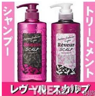
レヴュー YNET.com 时尚